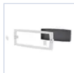
12179 SCAT INCASSO CORN BI LOGICALED