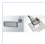
12199 STAFFA PARETE LOGICA IP65