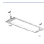
12180 STAFFA CONTROSOFF BI LOGICA LED