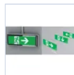
12175 SCHERMO LOGICA LED DX