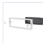
12179 SCAT INCASSO CORN BI LOGICALED