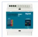
12101 TELECOMANDO LOGICA INIBIT RM