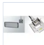
12199 STAFFA PARETE LOGICA IP65