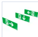
12177 SCHERMO LOGICA LED BS