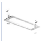
12180 STAFFA CONTROSOF BI LOGICA LED