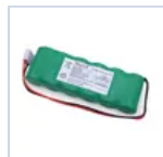
415409001 NIMH HT 7.2V 2.5AH SC PAC 530