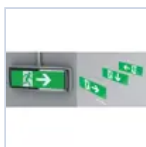
12176 SCHERMO LOGICA LED SX