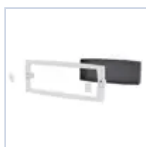
12179 SCAT INCASSO CORN BI LOGICALED