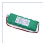
415409001 NIMH HT 7.2V 2.5AH SC PAC 530