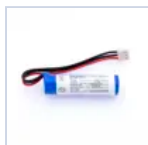
415437001 LI-FEPO4 3.2V 0.6AH 14500