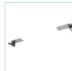
19049 STAFFA CONTROSOFFITTO F65 EX