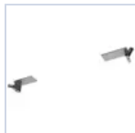
19041 STAFFA CONTROSOFFITTO F65