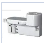
4319 KIT BINARIO TRIFASE UP LED