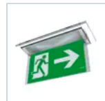
19042 SCHERMO BANDIERA DX/SX F65