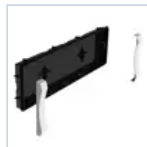
19048 SCAT INCASSO + CORNICE F65 EX