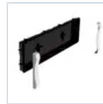
19040 INCASSO + CORNICI F65