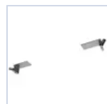
19041 STAFFA CONTROSOFFITTO F65