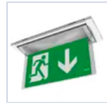
19043 SCHERMO BANDIERA BASSO F65