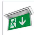
19043 SCHERMO BANDIERA BASSO F65