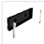
19040 INCASSO + CORNICI F65