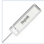
15037 MODULO LGFM