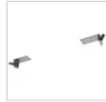
19041 STAFFA CONTROSOFFITTO F65