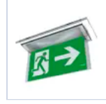
19042 SCHERMO BANDIERA DX/SX F65