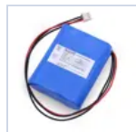
415444101 LI-FEPO4 9.6V 1.5AH 18650 3P