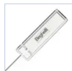
15037 MODULO LGFM