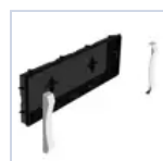
19048 SCAT INCASSO + CORNICE F65 EX