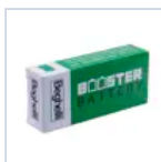
RA06 SISTEMA BAT AR LI-FE 9.6V1.5AH