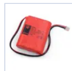
415444102 LI-FEPO4 9.6V 1.5AH 18650 3P T