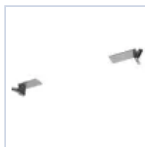
19049 STAFFA CONTROSOFFITTO F65 EX