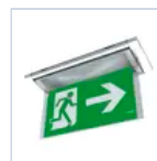
19042 SCHERMO BANDIERA DX/SX F65