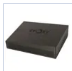
26723 CARTUCCIA EMERGENZA UVOXY