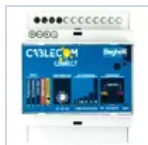
20151 CENTRALE CABLECOM CONNECT