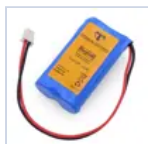
415418001 LTO 4.8V 0.5AH 14500 PACK