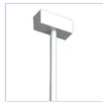
4315 SOSPEN TIGES L250