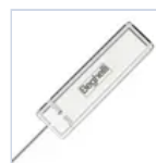
15037 MODULO LGFM