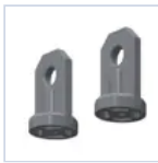
3723 GANCIO SOSPENSIONE 4004/PR