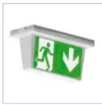
4681 SCHERMO BAND INFINITA 25MT