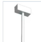
4316 SOSPEN TIGES L500