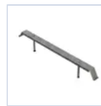
4687 STAFFA IN CARTONGESSO INFINITA