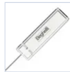
15037 MODULO LGFM