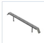
4687 STAFFA IN CARTONGESSO INFINITA