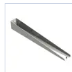
18585 STAFFA PARETE BAND P.MODULA