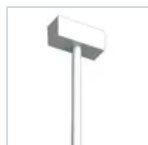
4316 SOSPEN TIGES L500