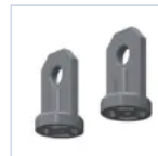
3723 GANCIO SOSPENSIONE 4004/PR