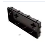
4683 SCATOLA INCASSO INFINITA