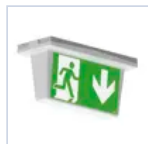
4681 SCHERMO BAND INFINITA 25MT