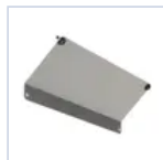
18590 STAFFA 45° P.MODULA