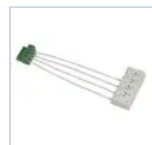
20155 PASSANTE INFINITA 5P