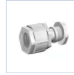
3727 GR PRESSATU 16/20- 4003/RG