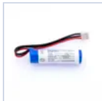
415437001 LI-FEPO4 3.2V 0.6AH 14500