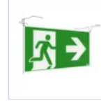
4127 SCHERMO BAND PRATICA SX/DX