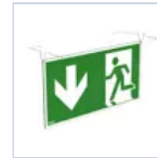
4128 SCHERMO BAND PRATICA BS