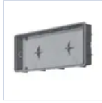
2741 INC COMPL 6-11 3974/IP