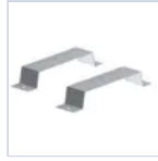
2751 KIT INST CONTROSOFF COMPL