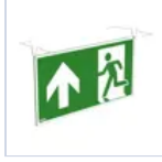
4129 SCHERMO BAND PRATICA UP