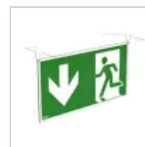
4128 SCHERMO BAND PRATICA BS