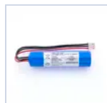
415436001 LI-FEPO4 3.2V 1.5AH 18650