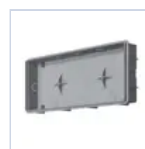
2741 INC COMPL 6-11 3974/IP