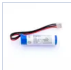
415437001 LI-FEPO4 3.2V 0.6AH 14500