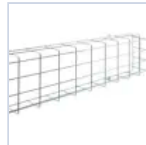
18591 GRIGLIA EM 305X135X80