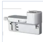
4319 KIT BINARIO TRIFASE UP LED