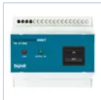
2730 INIBIT 973 COMANDO R.MODE