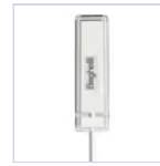
15048 MODULO RM PLUG