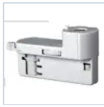
4319 KIT BINARIO TRIFASE UP LED