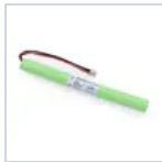
415457001 LI-FEPO4 3.2V 1.5AH PCM-ASTICK