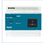
2730 INIBIT 973 COMANDO R.MODE