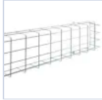
18591 GRIGLIA EM 305X135X80