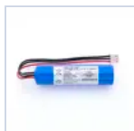
415436001 LI-FEPO4 3.2V 1.5AH 18650