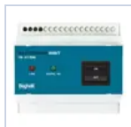
2730 INIBIT 973 COMANDO R.MODE