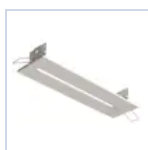
19880 INCASSO 20M