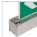
19882 LUCE SOPRA PORTA