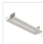
19881 INCASSO 30M