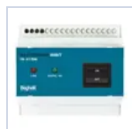
2730 INIBIT 973 COMANDO R.MODE