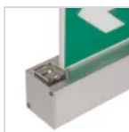
19882 LUCE SOPRA PORTA