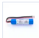
415436001 LI-FEPO4 3.2V 1.5AH 18650