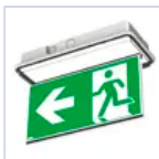
4124 SCHERMO BAND ECOMP LED SX/DX