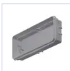
2742 INC COMPL ST 6/11 4974/IP