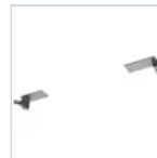
19041 STAFFA CONTROSOFFITTO F65