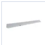
19045 STAFFA A PARETE X BANDIERA F65