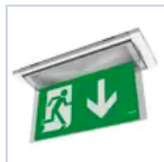
19043 SCHERMO BANDIERA BASSO F65