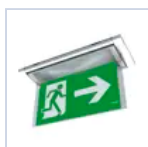
19042 SCHERMO BANDIERA DX/SX F65