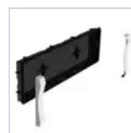
19048 SCAT INCASSO + CORNICE F65 EX