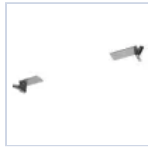
19049 STAFFA CONTROSOFFITTO F65 EX