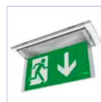
19043 SCHERMO BANDIERA BASSO F65