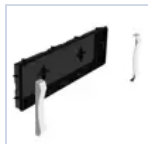
19048 SCAT INCASSO + CORNICE F65 EX