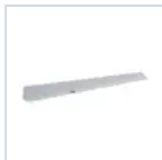
19045 STAFFA A PARETE X BANDIERA F65