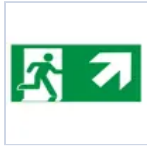
E16319M PITTOGRAMMA 30M DX SX ALTO