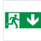
E16128M SCHERMO BASSO DISPOS