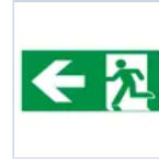
E16130M SCHERMO SINISTRA DISPOS