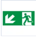
E16320M PITTOGRAMMA 30M SX DX BASSO