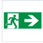
E16129M SCHERMO DESTRA DISPOS