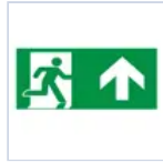
E16132M PITTOGRAMMA 30M ALTO