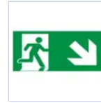
E16318M PITTOGRAMMA 30M DX SX BASSO