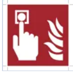
E16437 PULSANTE EMERGENZA