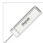
15037 MODULO LGFM