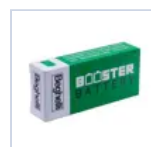
RA13 BOOSTER BAT LiFe 6.4V 1.5Ah