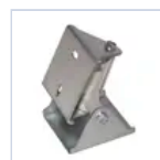
3504 BS100/110 STAFFE A PARETE