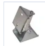
3504 BS100/110 STAFFE A PARETE