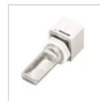
15050 MOD AUTODIM IP65