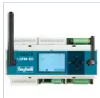
21102 CENTRALE DOMOTICA SD- LGFM