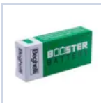
RA13 BOOSTER BAT LiFe 6.4V 1.5Ah