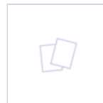
40480 ADAPTER RING 24W 110 TO 220MM