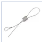
70059 KIT CAVETTO DI SICUREZZA