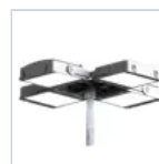
12662 TESTA PALO 4X 60-76