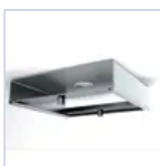
12659 STAFFA FISSAGGIO BARRA ELET MF