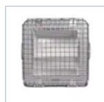
12657 GRIGLIA PRO/RIF MED