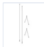
12663 CAVO SOSPENSIONE RIFLETTORE