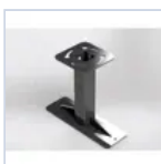
12664 STAFFA FISSAGGIO PLAFONE