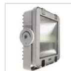
12666 STAFFA GONIOMETRICA RIF PRO FH