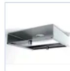
12659 STAFFA FISSAGGIO BARRA ELET MF