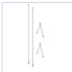
12663 CAVO SOSPENSIONE RIFLETTORE