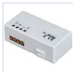
20104 TRASMETTITORE RADIO DOMOTICO