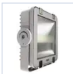
12666 STAFFA GONIOMETRICA RIF PRO FH