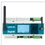
21102 CENTRALE DOMOTICA SD- LGFM