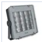
12658 GRIGLIA PRO/RIF GRANDI