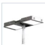
12661 TESTA PALO 1X-2X D=60- 76MM