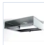
12659 STAFFA FISSAGGIO BARRA ELET MF