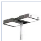
12661 TESTA PALO 1X-2X D=60-76MM