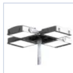
12662 TESTA PALO 4X 60-76