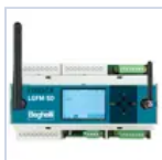
21102 CENTRALE DOMOTICA SD-LGFM