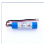
415436001 LI-FEPO4 3.2V 1.5AH 18650