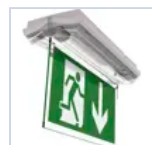
4268 SCHERMO BAND BASS DES/COMP LED