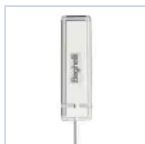
15048 MODULO RM PLUG