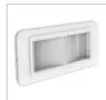
4112 KIT GUSCIO IP66 COMPLETA LED