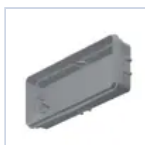
3733 INCASSO STILE 6/11W 3106/IP