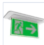
4267 SCHERMO BAND DXSX DES/COMP LED