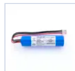
415436001 LI-FEPO4 3.2V 1.5AH 18650