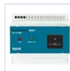
2730 INIBIT 973 COMANDO R.MODE