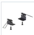
4266 STAFFA CONTROSOFFITTO DES/COMP