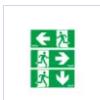
4269 SCHERMI DX/SX/BS DES/COMP LED