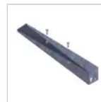
4265 STAFFA PARETE X BAND DES/COMP