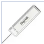
15037 MODULO LGFM