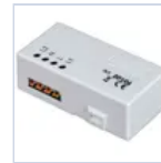
20104 TRASMETTITORE RADIO DOMOTICO