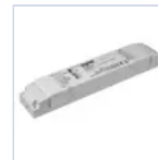
19398 INV UNIV AT RM 5W 20-240V