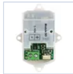
15034 MODULO 1-10V