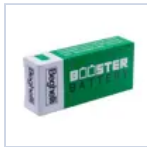
RA13 BOOSTER BAT LiFe 6.4V 1.5Ah