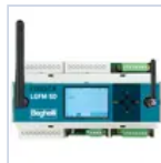
21102 CENTRALE DOMOTICA SD-LGFM