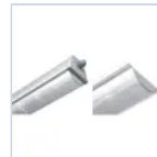
20113 SCHERMO ACC PROTEZ HCCP 1500