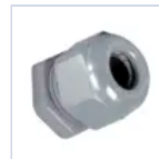
15018 KIT ATEX ACCIAIO ECO