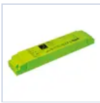
19367 INV P&L LED SE/SA 1H 60-180V