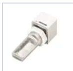
15051 MOD AUTODIM RADIO IP65