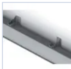
20122 STAFFA ORIENTABILE ACC E LED