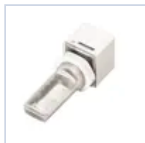
15050 MOD AUTODIM IP65