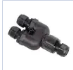
15019 RACCORDO DOPPIO INGRESSO M20