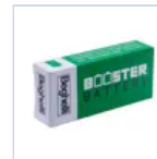
RA13 BOOSTER BAT LiFe 6.4V 1.5Ah