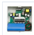
15068 MODULO TR 6W 1/3H BS UNO