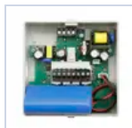
15068 MODULO TR 6W 1/3H BS UNO