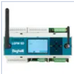
21102 CENTRALE DOMOTICA SD-LGFM