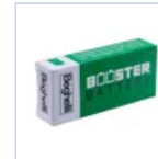
RA13 BOOSTER BAT LiFe 6.4V 1.5Ah