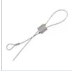
70059 KIT CAVETTO DI SICUREZZA