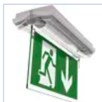
4268 SCHERMO BAND BASS DES/COMP LED