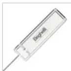
15037 MODULO LGFM