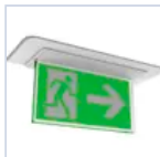
4267 SCHERMO BAND DXSX DES/COMP LED