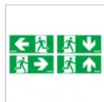
4278 ADES SX/DX/BS/UP COMP LED