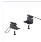
4266 STAFFA CONTROSOFFITTO DES/COMP