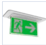
4267 SCHERMO BAND DXSX DES/COMP LED