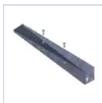
4265 STAFFA PARETE X BAND DES/COMP