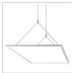
70100 SUSPENSION 4 HOOK PANELED