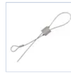
70059 KIT CAVETTO DI SICUREZZA