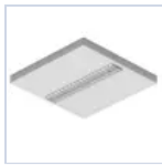
20101 KIT FRAME PLAF BACKLITE 30X120