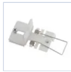
70039 KIT CONTRO SOFFITTO PAN RTI