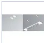
20081 P236/58 LED SOSP+CAVO SINGOLO