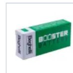
RA13 BOOSTER BAT LiFe 6.4V 1.5Ah