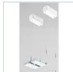
20087 STAFFA + CAVO TRIFASE PASSANTE