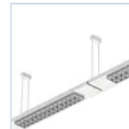
20088 CAVO FILA CONT PLAFO