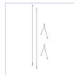
12663 CAVO SOSPENSIONE RIFLETTORE