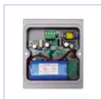
15069 MODULO TR 6W 1/3H PROIETTORI