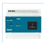
2730 INIBIT 973 COMANDO R.MODE