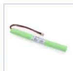
415457001 LI-FEPO4 3.2V 1.5AH PCM- ASTICK