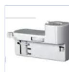
4319 KIT BINARIO TRIFASE UP LED