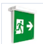
4325 SCHERMO BAND UPLED DX SX BS UP