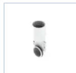
4318 ACCESSORIO IP65 UP LED 824