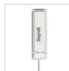
15048 MODULO RM PLUG