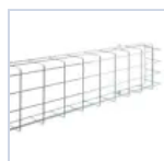
18591 GRIGLIA EM 305X135X80