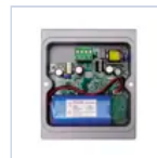
15069 MODULO TR 6W 1/3H PROIETTORI