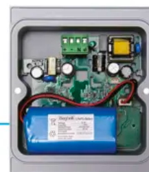
Modulo di emergenza opzionale