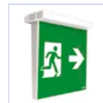
4325 SCHERMO BAND UPLED DX SX BS UP