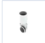
4318 ACCESSORIO IP65 UP LED 824