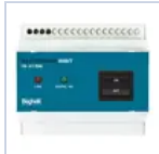
2730 INIBIT 973 COMANDO R.MODE