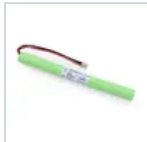
415457001 LI-FEPO4 3.2V 1.5AH PCM- ASTICK