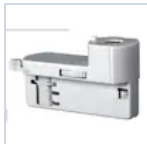
4319 KIT BINARIO TRIFASE UP LED